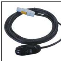
リモートスイッチケーブル