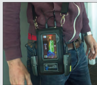
※Quantum バックはオプションです。